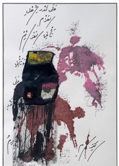
Jetzt zu sehen: Eine unbetitelt Arbeit des syrischen Künstlers Adonis aus dem Jahr 2016. TAKLA-STIFTUNG

Die Ausstellung „Im Bestand“ ist bis zum 18. April zu sehen. Nach einer Umbaupause beginnt am 24. April eine Ausstellung zur Verleihung des Takla-Förderpreises für junge Kunst aus Syrien. Das „Haus der syrischen Kunst“ öffnet mittwochs und freitags in der Zeit von 14 bis 17 Uhr sowie samstags von 12 bis 17 Uhr. THOMAS KUZAJ