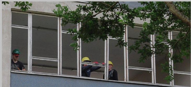
Der Sanierungsbedarf an öffentlichen Gebäuden und Schulen in Bremen ist hoch. Es werden viele Milliarden Euro benötigt.

Ermittelt wird der Sanierungsbedarf im Rahmen der Zustandsbewertung Bau. Dabei handelt es sich um ein Instrument zur Bewertung des Gebäudebestands, das insbesondere für die strategische Bauprogrammplanung genutzt wird, teilt die Verwaltung mit. Der Zustand der Gebäude werde dabei zerstörungsfrei durch Inaugenscheinnahme beurteilt; weitergehende Untersuchungen – etwa zu Statik, Schadstoffen oder detaillierten energetischen Anforderungen – fließen zunächst nicht ein. Betrachtet werden einzelne Bauteile wie Dach, Fassade, Fenster oder technische Anlagen, die einem akuten, mittel- oder langfristigen Sanierungsbedarf zugeordnet und mit Kostenschätzungen hinterlegt werden. Daraus wird ein monetärer Gesamtsanierungsbedarf errechnet, der jedoch keinen abschließenden Wert darstellt. Berücksichtigt wird nach Ver-